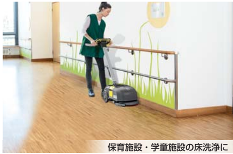
保育施設・学童施設の床洗浄に