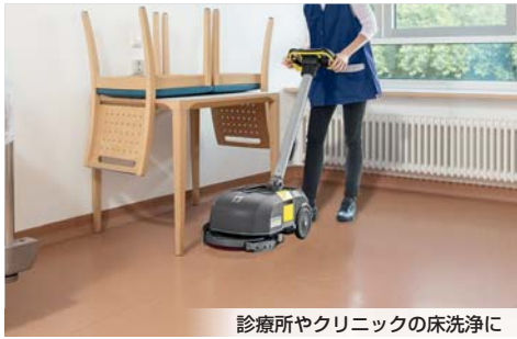
診療所やクリニックの床洗浄に