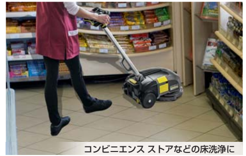
コンビニエンスストアなどの床洗浄に